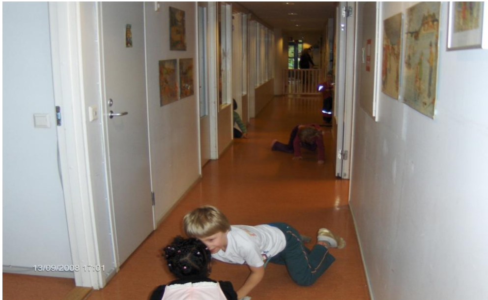
Kuva 3: Kaikki tilanteet ovat liikuntahetkiä! Lapset siirtyvät keksimillään liikuntatavoilla rakentamaan unelmien pihaa.

Mieli ja ruumis eivät ole eri asioita; ne ovat kaksi eri tapaa tarkastella samaa kohdetta, A. Einstein, 1937