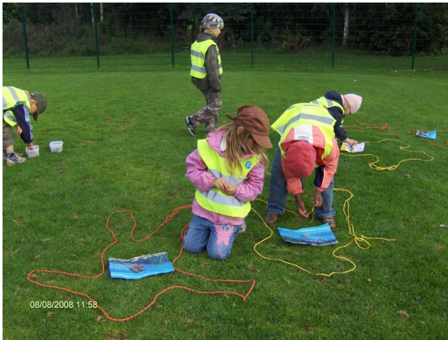
Kuva 1: Kehonhahmottamista ja oman nimen alkukirjaimen kirjoittamista nurmikentällä

Psykomotorisia leikkejä ja harjoituksia olivat kehon hahmottamiseen liittyen: mm. kaverin kehon rajat naruilla, liikkuminen kapeilla pitkospuilla jonossa, pujahtamiset mataliin tai kapeisiin paikkoihin, tilan (ympäristön) havainnointiin ja valloittamiseen liittyen: mm. suunnistaminen kartan avulla yhdessä ja yksin; leikit, joissa etsitään tavaroita ympäristöstä (Kissa- ja pupuperhe), välimatkojen arviointi naruilla ja omalla keholla, nurkka/rengasleikki, hippaleikit erilaisissa maastoissa sekä sosiaalinen kokemukseen ja yhdessä tekemiseen liittyen: pallo kertoo mukavia asioita toisesta; juoru kulkee piirissä; Kissa- ja pupuperheleikki, parihippa, Kapteeni käskää ja Seuraa johtajaa -leikit lasten ohjauksessa monine muotoineen. Retki ympäristöt olin valinnut siten, että niissä liikkuesssa tarvitaan monenlaisia motorisia ja muita taitoja (esimerkiksi kärsivällisyys, uskalus, tarkkojen havaintojen teko, tasapaino, kestävyys, oman kehon sekä tilan ja suuntien hahmottaminen).