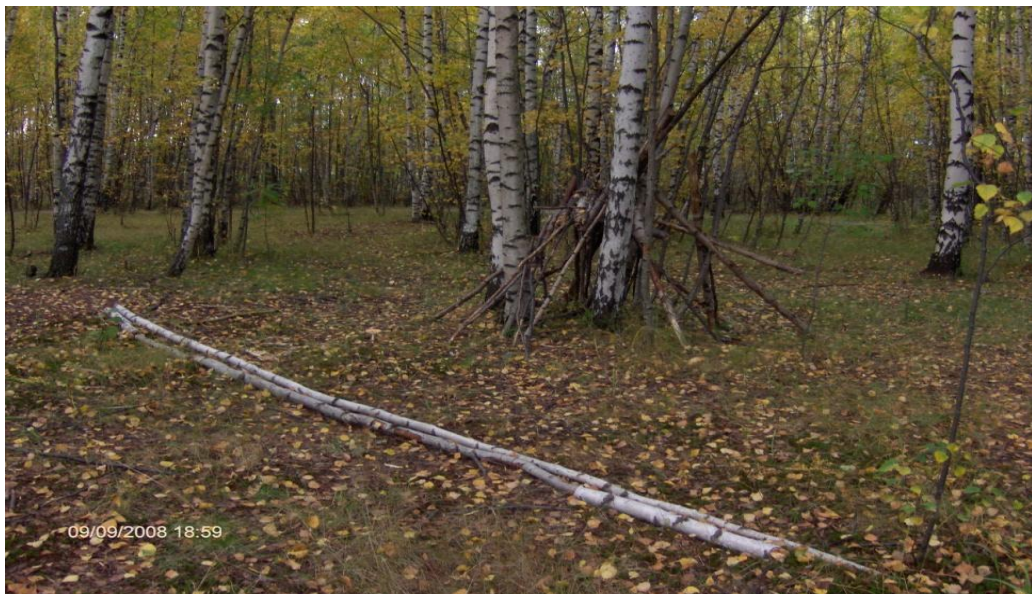
Kuva 2: Leikkipaikan maja ja poikien pitkospuut